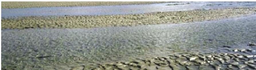
filmmontage strandbakje Nuformer Digital Media, Zierikzee overige montage Jaap Verseput, Zonnemaire, redactie Josien Pootjes, Middelburg

Wat is nou inspirerender dan patat te eten uit een bakje met de identiteit van datgene waarvoor velen hier komen recreëren? Of recreatiever dan de grens te beleven tussen geschiedenis en toekomst?